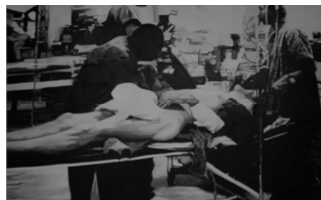
"Víctimas de bombardeos serbios a zona croata por encima de las posiciones bosnias en Mostar. (A partir de imagen aparecida en Tve-1)", 1996. Oli sobre cotó, 241 x 390 cm.

qüestiona formes i mecanismes de representació comuns i molt presents en l'esfera pública actual i, a més, treu a la llum els usos i manipulacions a què se sotmeten els conflictes bèl·lics i, de manera específica, el tractament visual de què són objecte les víctimes, sobretot civils, en el món mediàtic i comunicacional. Així mateix, ens interpel·la a nosaltres, els espectadors, sobre la nostra "capacitat" de conviure amb tanta barbàrie. El mateix Simeón Saiz assenyala: "[...] si la primera pregunta que llancen aquests quadres és: ¿qui va matar les persones que hi apareixen? Una altra igualment pertinent seria: ¿com som capaços de viure amb aquestes imatges?"