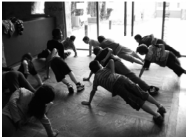
Foto: taller de hip-hop / break dance

En el marc del programa d'oci alternatiu del Pla Local de Joventut, la Regidoria de Joventut va proposar per les vacances de Setmana Santa la realització de tallers gratuïts durant les tardes de dilluns, dimarts i dimecres. Aquests tallers anaven adreçats a nens/es de primària i als joves d'ESO, i varen tenir molt bona acceptació.